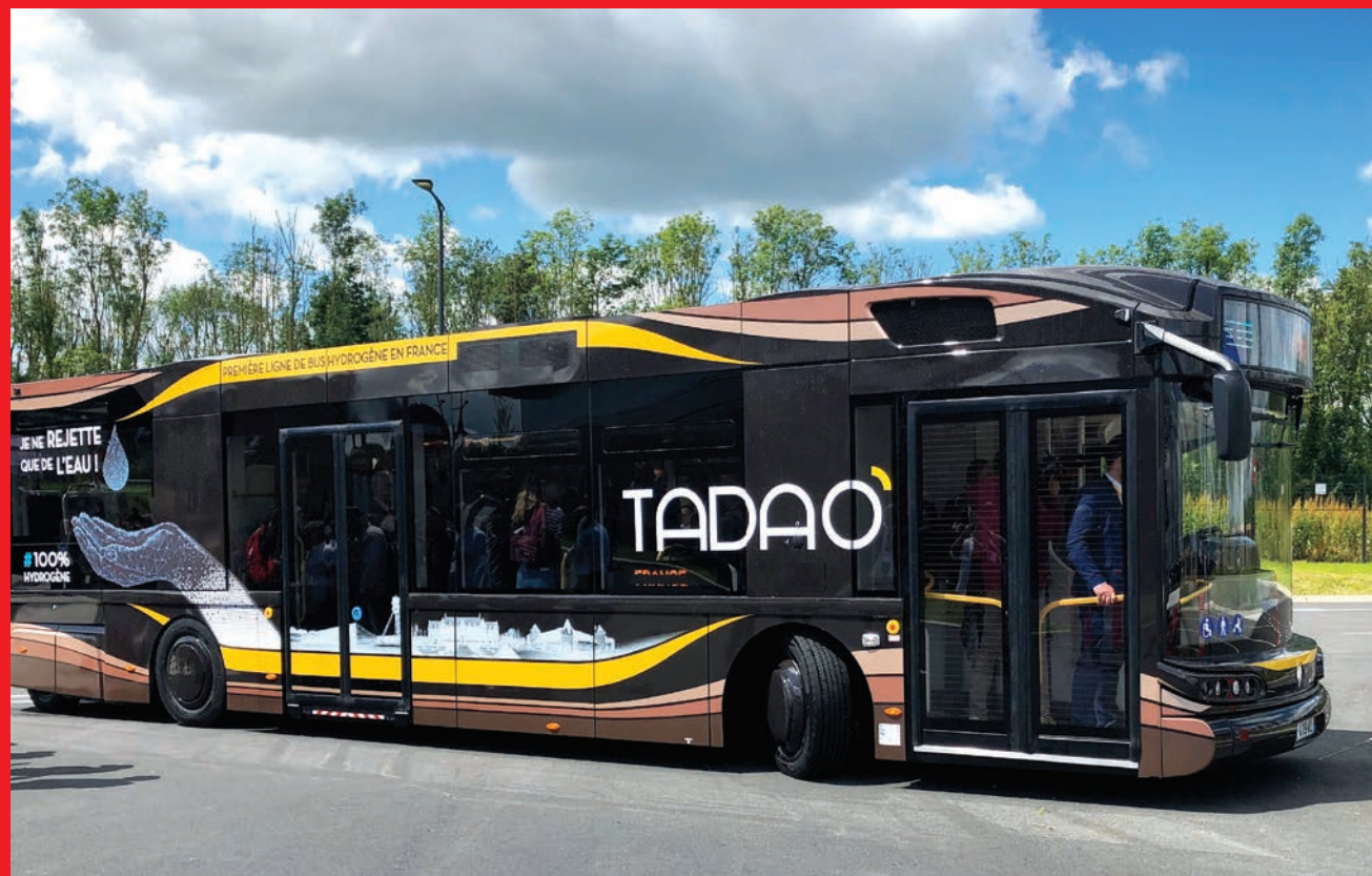
Réseau Tadao - Lens - Premiers bus à hydrogène de France.